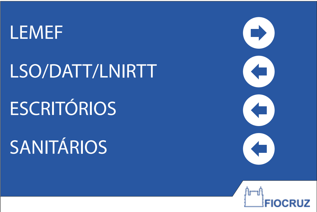
PDI 02 40x60CM