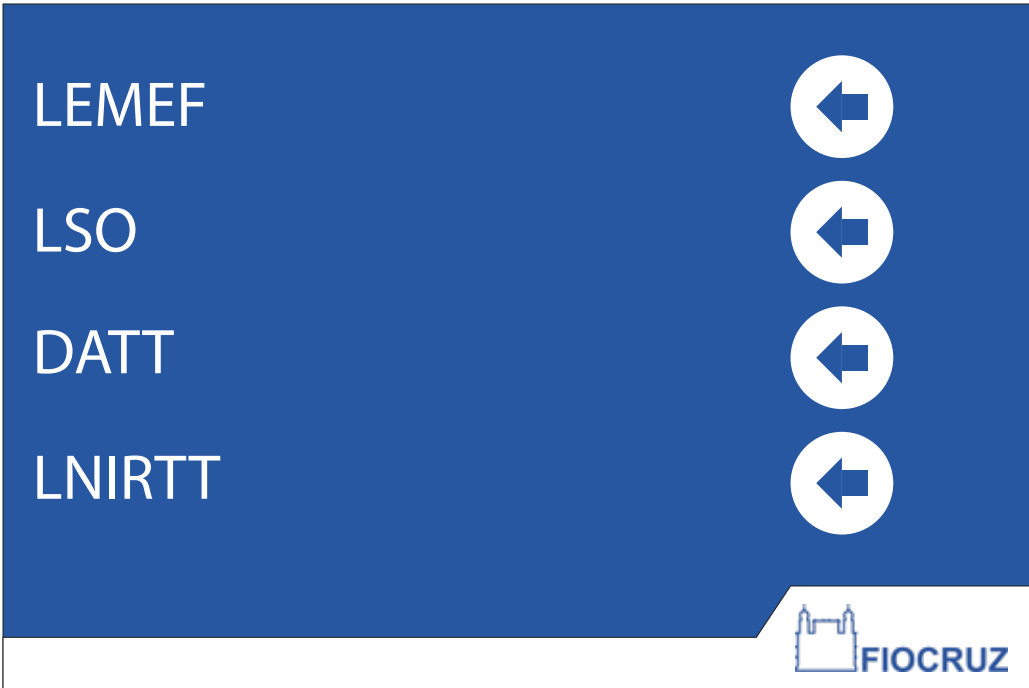
PDI 01 40x60CM