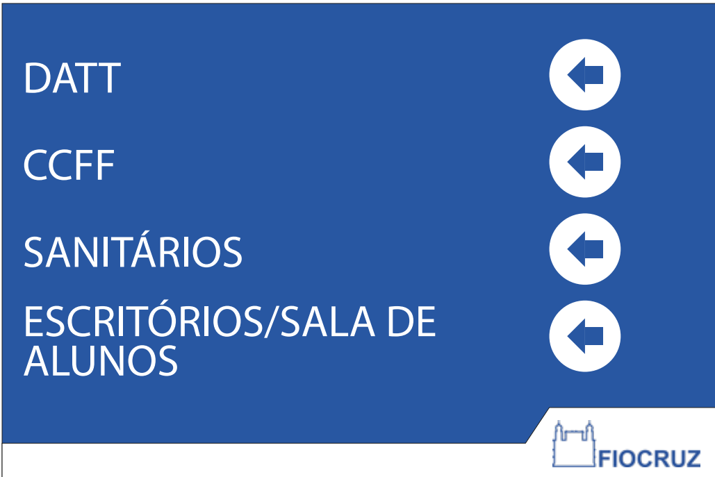
PDI 09 40x60CM