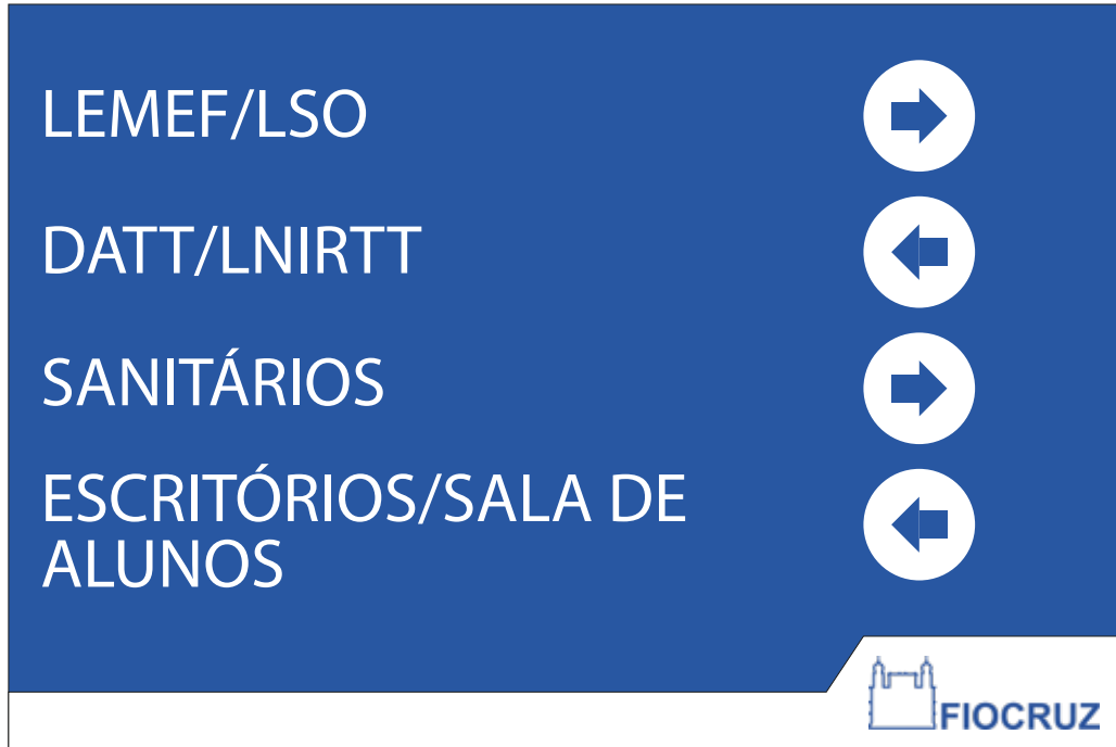
PDI 03 40x60CM