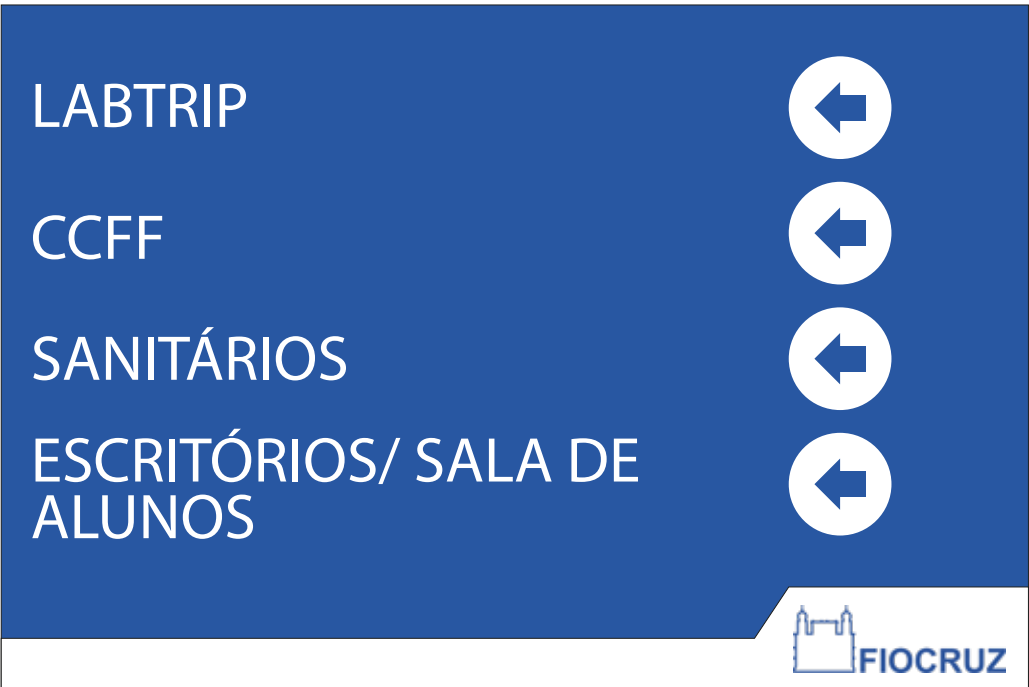
PDI 10 40x60CM

NOTAS 01 - TODAS AS DIMENSÕES ESTÃO EM CENTÍMETROS; 02 - CONFERIR DIMENSÕES DAS ESQUADRIAS IN LOCO PARA EXECUÇÃO DA CMV; 03 - EM CASO DE DÚVIDAS, CONSULTAR RESPONSÁVEL TÉCNICO.