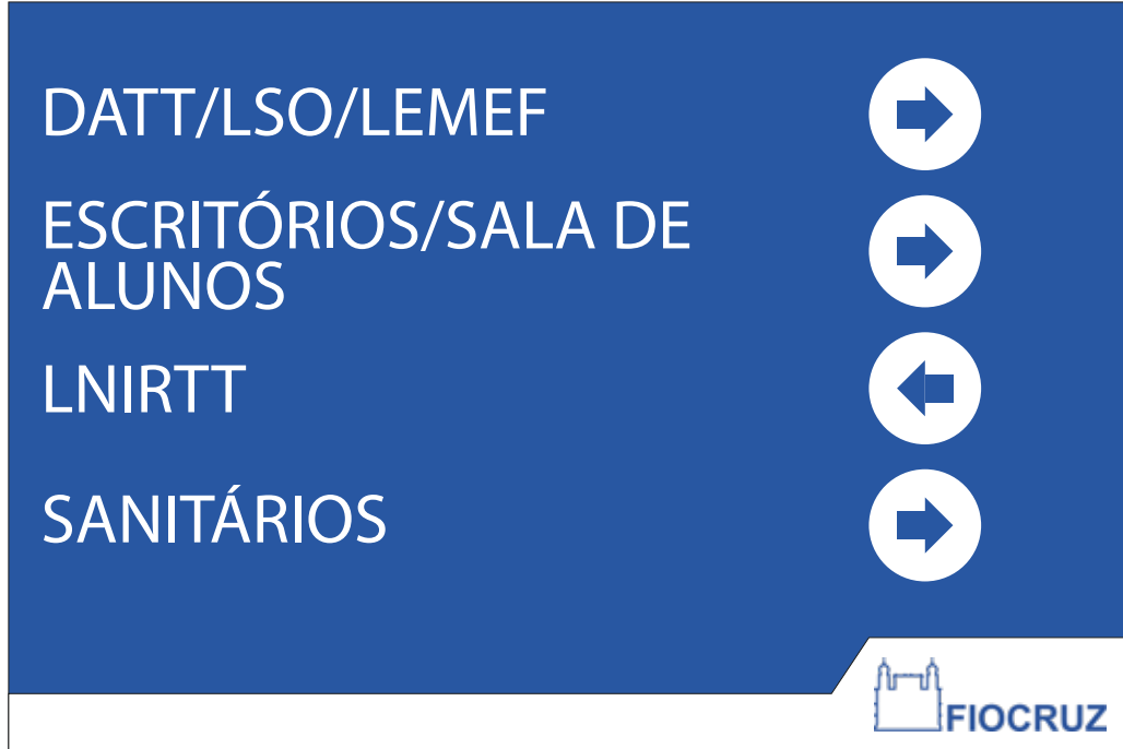
PDI 06 40x60CM